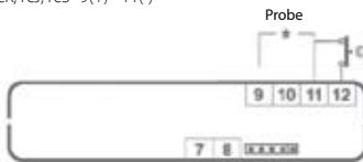
110/230VAC HOT KEY Power Supply